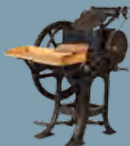
Máquina de impressão Minerva da marca Hogenforst, fabricada na Alemanha por Machin Fabrick, nas décadas de 1920 ou 1930. Funciona por accionamento de pedal EMS.1999.00312.00000