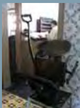
Máquina de impressão Minerva da marca Hogenforst, fabricada na Alemanha por Machin Fabrick, nas décadas de 1920 ou 1930. Funciona por accionamento de braço EMS.2009.00704.00000