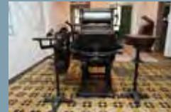
Máquina de impressão Minerva da marca Phoenix Presse, fabricada na Alemanha por Schelter & Giesecke S.G., nas décadas de 1930 ou 1940. Funciona com energia eléctrica EMS.2010.00125.00000